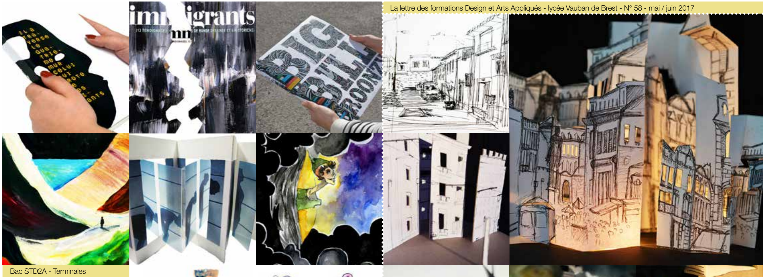
Bac STD2A - Terminales