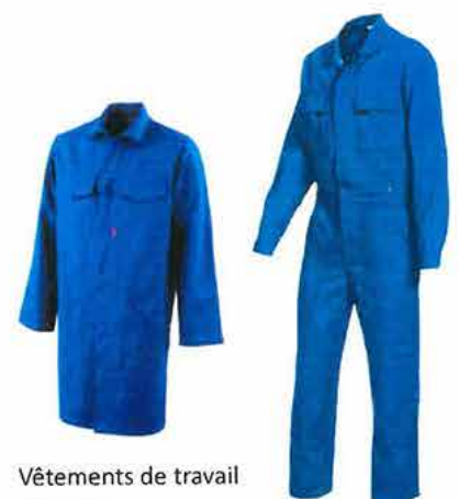
Vêtements de travail en coton