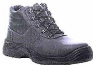
Chaussures de sécurité