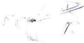
Lunettes de protection soudage et meulage